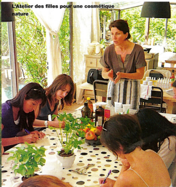
L'Atelier des filles pour une cosmétique nature

« tout ce qu'on se met sur la peau devrait pouvoir être mangé » ! Première étape de cette rencontre intitulée « Je débute », la fabrication d'un démaquillant pour le visage et les yeux doux et hydratant à souhait. Grâce à un mini entonnoir, nous faisons glisser dans une petite bouteille en plastique le gel natif d'Aloe Vera, l'huile végétale puis l'eau floral auxquels nous ajoutons une goutte d'extrait de pépin de pamplemousse pour aider à la bonne conservation. Simple comme l'air, il ne reste qu'à secouer énergiquement et c'est prêt ! Les premiers effluves de fleurs parfument l'atmosphère qui n'est pas sans rappeler celle de certains cours de cuisine fictive lorsque nous jouions à la dinette. Passionnée et convaincue des bienfaits du bio et du naturel pour notre santé et donc notre peau, l'intervenante explique les propriétés de chacun des éléments et prodigue de multiples conseils et astuces. La bonne humeur s'invite autour de la table et chacune compare la consistance de ses produits tout en prenant des notes. En deux heures et quelques tours de main vite maîtrisés, nous confectionnons encore un exfoliant qui fait la peau douce à base de miel, d'huile végétale et de sucre ou de poudre d'amande pour les peaux les plus fragiles puis un masque, revitalisant à base d'argile blanche ou de farine semi complète, agrémentées de jus de citron, de miel, d'huile végétale. Cette première session a sans