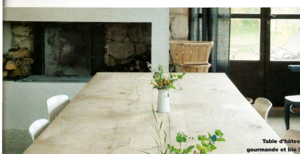
Table d'hôtes gourmande et bio !

Cette première session a sans conteste ouvert des appétits de nature ! Promis, certaines reviendront pour compléter leurs savoirs et suivre la deuxième étape « Je me débrouille bien » puis la troisième « Je suis parfaite ». On l'aura compris, l'humour comme le rire, sont aussi des ingrédients beautés vivement recommandés. Pour clore cette matinée, nous visitons cette ferme généreuse et très nature nichée dans un vaste vallon verdoyant, où l'on peut acheter les légumes et fruits du jardin, des confitures maison et rendre visite aux moutons, ânes, oies, poules et lapins ! Avant de passer à table pour une assiette spéciale saveur et minceur, bio il va de soit ! ●