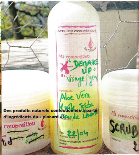
Des produits naturels confectionnés à partir d'ingrédients du « placard »