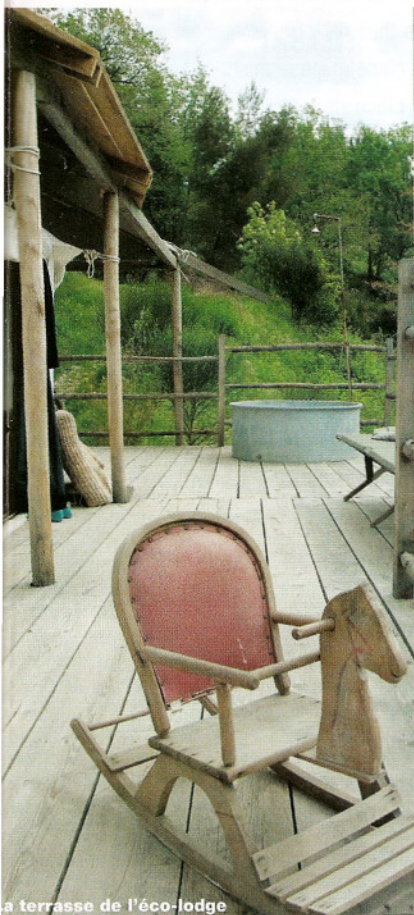
la terrasse de l'éco-lodge